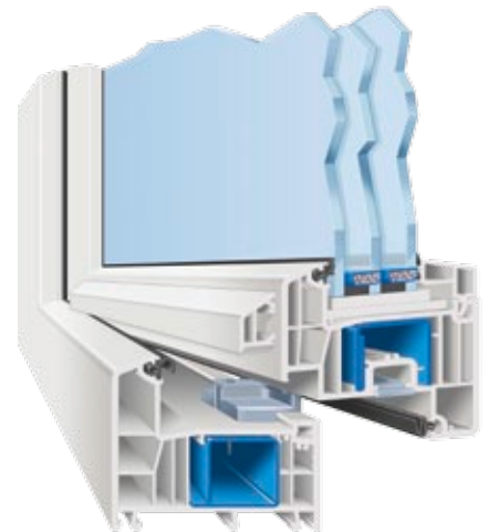
AFINO-one AD (Anschlagdichtungssystem mit zwei Dichtungen)