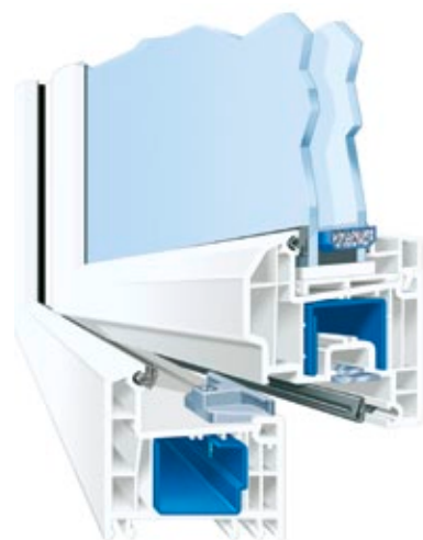
Systemschnitt Castello halbflächenversetzt