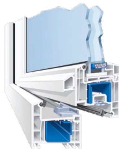
Systemschnitt Castello flächenversetzt